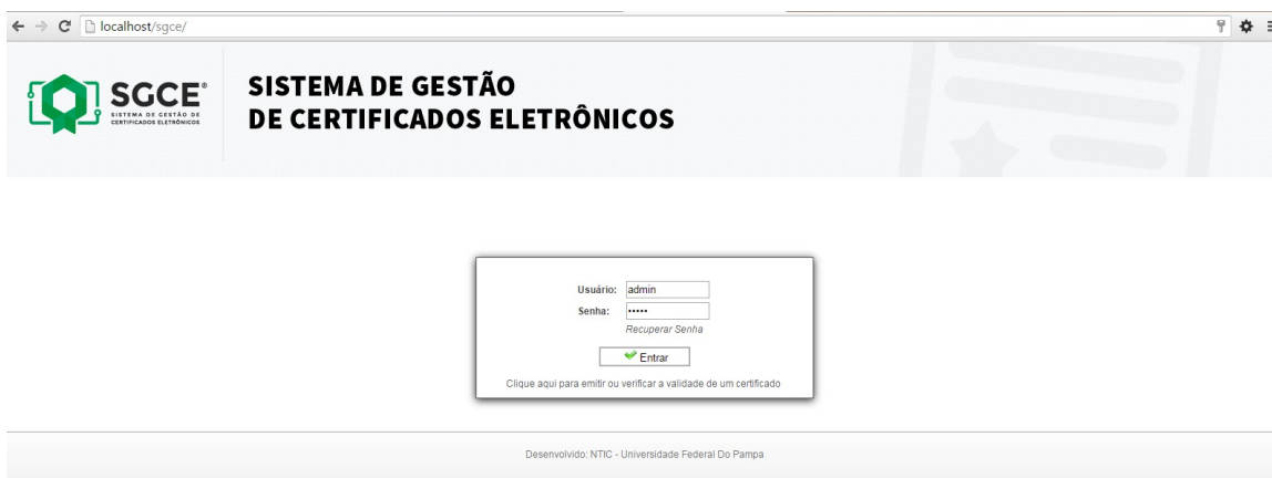
Imagem 2 - Tela de Login do SGCE

Para o primeiro acesso ao sistema, navegue até a URL onde o sistema está instalado e utilize o nome de usuário 'admin' e senha 'admin' (sem aspas), conforme Imagem 2.